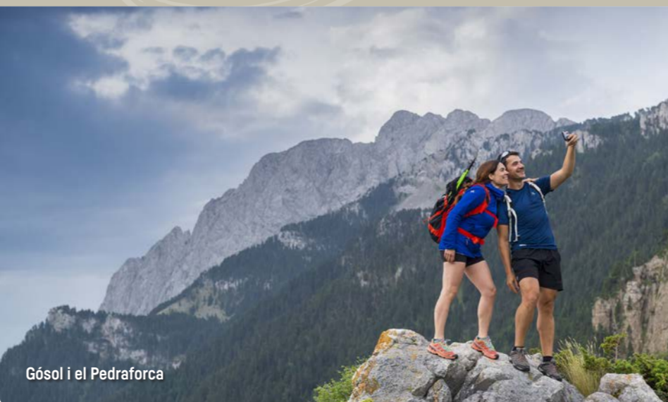
Gósol i el Pedraforca

Services / Serveis / Servicios / Services i [Icons]