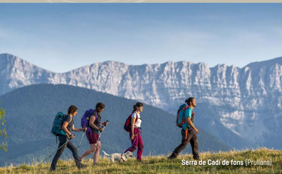
Serra de Cadí de fons (Prullans)

Services / Serveis / Servicios / Services i [Icons] Variante hivernale possible par Latour de Carol, Mérens, Bellver de Cerdanya