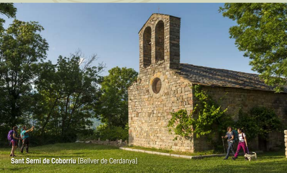
Sant Serni de Coborriu (Bellver de Cerdanya)

Services / Serveis / Servicios / Services i [Icons]